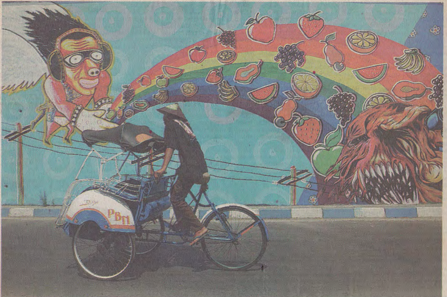
Lokasi: Jembatan Layang Lempuyangan, Yogyakarta.