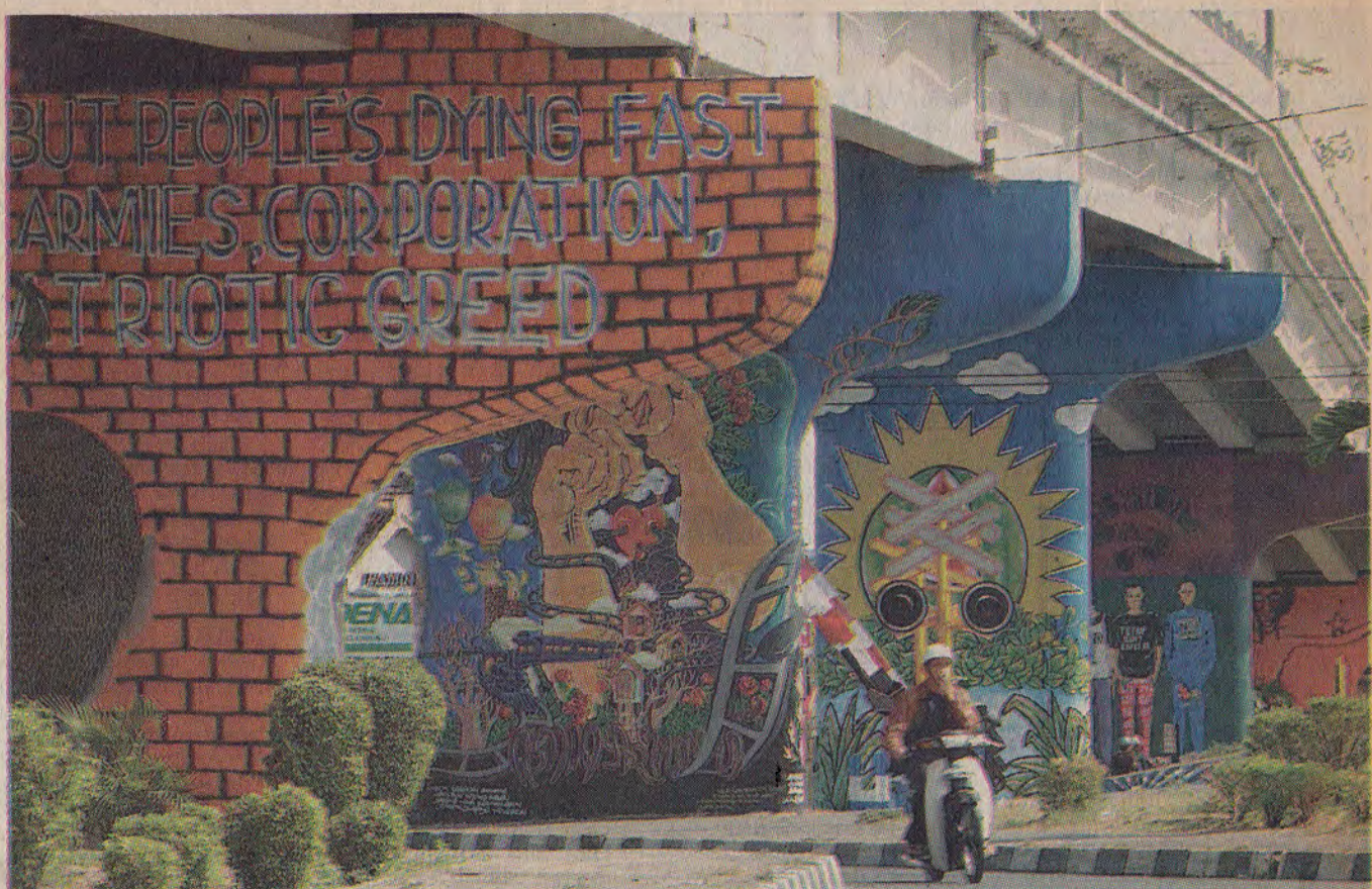
Lokasi: Jembatan Layang Lempuyangan, Yogyakarta.